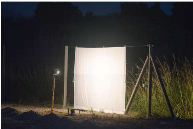
Trampa de foco halógena y lienzo reflectante.