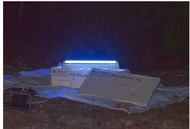
Trampa de luz actínica.