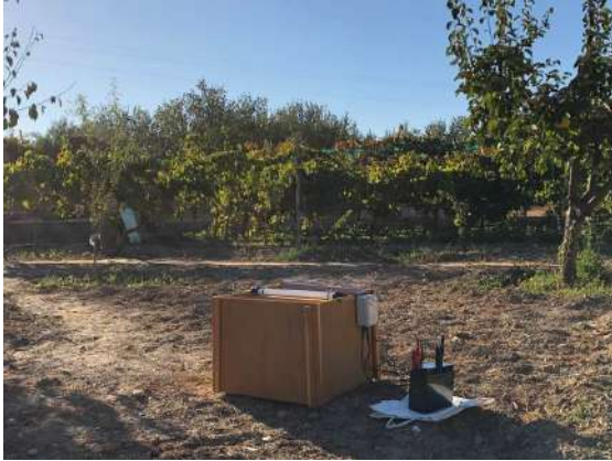
Trampa modelo Skinner autónoma.