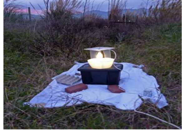
Aspecto de la trampa Robinson HM 70w.